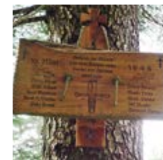
So präsentierte sich die offensichtlich zum zweiten Mal erneuerte, geheimnisvolle Gedenktafel im Wald, als 2024 das Bild entstand; die erweiterte Aufschrift lässt vermuten, dass jemand, der in „Deckung“ bleibt, mehr weiß.