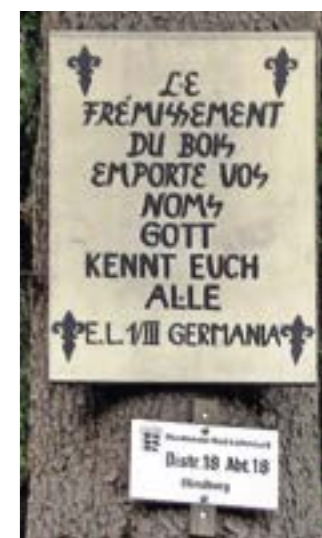
Die zweiten Gedenktafeln im Staatswald distrikt Blindberg waren 200 Meter voneinander entfernt, sahen so aus und unterschieden sich kaum von den ersten; diese Bilder aus dem Archiv Fritz Barth sind in dessen Buch „Hoffnung – Krieg – Not“ 2010 schwarz-weiß abgedruckt.

Einige Zeit nach der Besetzung Zwerenbergs im April 1945 hält Lang fest, „aus besonderen Gründen“ könnten die Aufzeichnungen nicht fortgeführt werden. Vielleicht sei es später möglich, „diese furchtbaren Erlebnisse aus dem Zusammenbruch des Hitlerreichs noch niederzuschreiben“. Dann trägt er im Mai 1950 unter dem 4. April 1945 zu deutschen Einheiten auf dem Rückzug nach: „Ein Pferdelazarett mit 120 Pferden kommt an, fast gleichzeitig eine Infanterieeinheit Böckka, mit diesem Hauptmann erlebte ich eine entsetzliche Auseinandersetzung, dass er mir drohte, er werde mich umlegen lassen, weil ich auf dem Rathaus gesagt hätte, die Frauen und Mädchen sollen sich nicht, wegen zu befürchtender