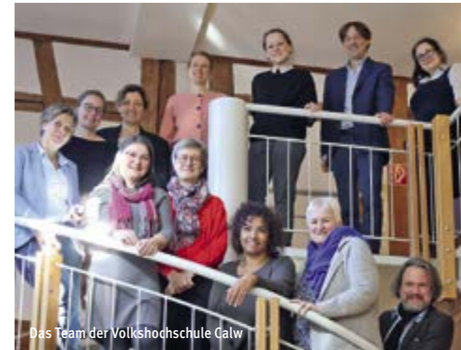
Das Team der Volkshochschule Calw

Haben die Gemeinden Einfluss darauf, welche Kurse bei ihnen angeboten werden?