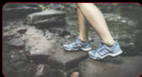
Erlebniswanderung: Durchs Monbachtal* Samstag, 22.03.2025