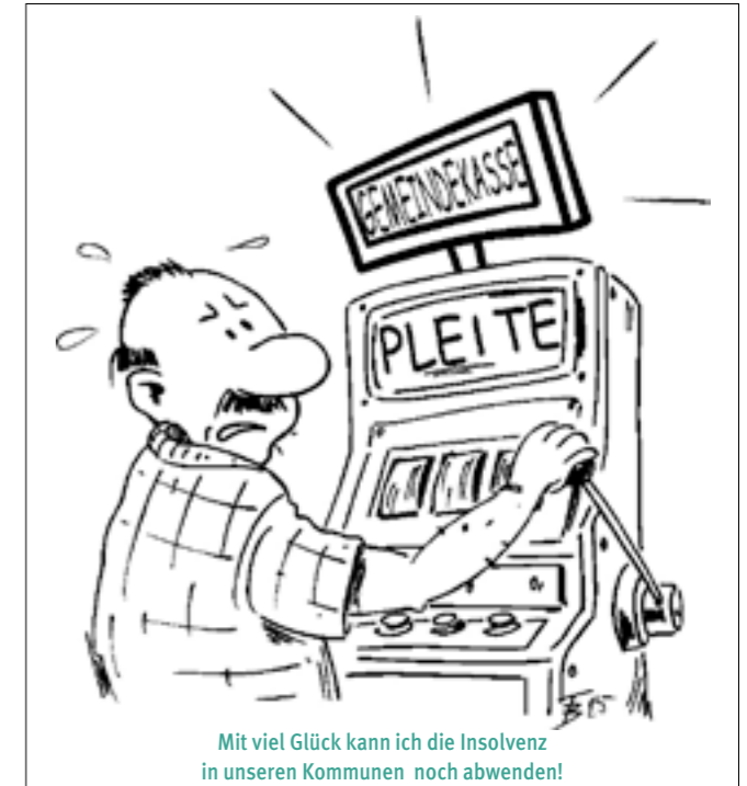
Mit viel Glück kann ich die Insolvenz in unseren Kommunen noch abwenden!

Was braucht es, um Volkshochschulen zukunftsfähig zu machen? Zuerst zuverlässige Rahmenbedingungen und eine stabile Grundfinanzierung, da gab es in den letzten Jahren zu viele Unsicherheiten, die Kraft kosten. Wandlungsbereitschaft haben nach meinem Eindruck die Volkshochschulen in den letzten Jahrzehnten immer wieder bewiesen, und das, ohne ihre zentrale Aufgabe, lebenslanges Lernen für