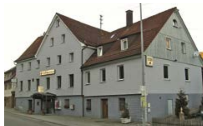
Im Gasthaus Löwen am Ortsrand in Richtung Hirsau hatte das französische Kommando nach der Besetzung von Oberreichenbach seine Kommandantur. Das Foto stammt von Anfang 2011, als die Gaststätte noch betrieben wurde.

Für die meisten ist es heute Geschichte, wenige erinnern sich oft noch mit Schrecken daran: Das Kriegsende sorgte vor 80 Jahren für Erleichterung, brachte aber auch manche Not, Pflicht und Sorge mit. In Oberreichenbach drohte der französische Ortskommandant mit Erschießungen, in Zwerenberg tat dies ein deutscher Offizier gegenüber dem Bürgermeister.