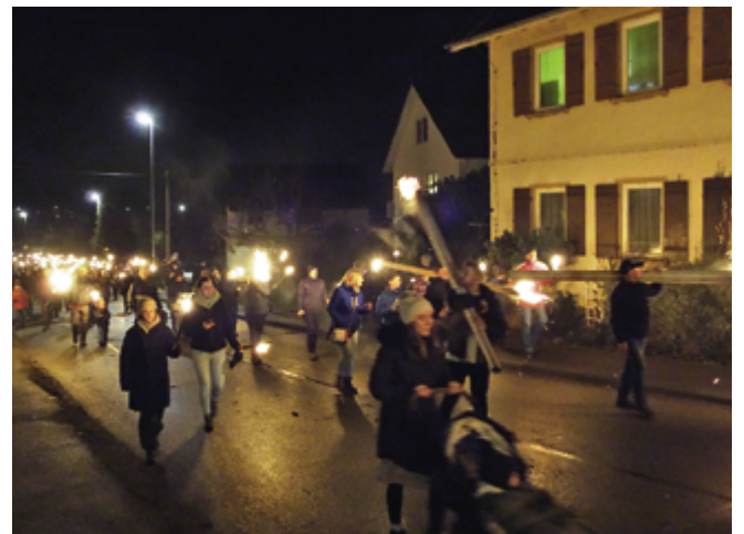
Etwa einen halben Kilometer lang war 2023 der Zug der Fackelträger, die teils die langen, historischen und selbstgebastelten Kienspanfackeln, teils handelsüblichen loderndes Feuer rund um Zwerenberg trugen.

In der Zeitung „Der Enzthäler“ vom 28. September 1898 war in einem Artikel aus Calw zu lesen: „Ein alljährlich wiederkehrender Brauch ist gestern Abend wieder für 1 Jahr beendet worden. Seit 3 Tagen findet abends das Fackeln der Schuljugend statt. Alle Abend wird auf dem hohen Felsen oberhalb der Stadt ein Feuer angezündet und Feuerwerk abgebrannt. Nach Erlöschen des Feuers zieht die Schar, verschiedene Lieder singend und eine Fackel in der Hand haltend auf den Brühl, wo oft von 100 und mehr Personen die brennenden Fackeln geschwungen werden. Früher dauerte das Fackeln, das schon viele Jahrhunderte hier besteht, 3 Wochen, jetzt ist es noch auf eine Woche beschränkt.“ Am 23. Oktober 1861 heißt es im Calwer Wochenblatt, dass vier Tage zuvor der Jahrestag der Völkerschlacht bei Leipzig in der Stadt „durch zwei Freudenfeuer und einen herrlichen Fackelzug, an welchem sich ungefähr 300 Personen beteiligten, sowie durch gesellige Vereinigung patriotisch gesinnter Männer im Badischen Hof“ gefeiert worden sei. 1895 berichtet das Wochenblatt, dass zum 25-jährigen Bestehen der Siegesfeier nach dem Krieg von 1870/71 in „herkömmlicher Weise“ am 2. September gefeiert werden soll mit: „am Vorabend Freudenfeuer auf dem hohen Felsen, am Festtag selbst Böllerschließen, Festgottesdienst, nachmittags