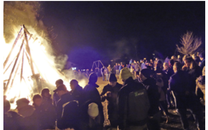
Als der Holzstoß in Zwerenberg 2023 so richtig brannte, wurde der Kreis angereizter ehemaliger Zwerenberger, Einheimischer und Gäste aus der Umgebung um das Feuer hitzebedingt größer, um bald wieder enger zu werden.

Schloßberg.“ Dokumentiert ist, dass nach Ebhausen das Fackeln 1895 der Lehrer Steimle aus Altensteig gebracht hat. Als sich 2023 hinter der Kirche in Zwerenberg der Fackelzug mit Hunderten Teilnehmern und etwa 500 Metern Länge auf den Weg durch und um den Ort machte, waren darunter Kinder vom „Schüles“-Alter bis hin zu Erwachsenen im Seniorenalter. Angezündet wurden die Fackeln an einem kleinen Feuer. Am Ende des Umzugs landeten die noch brennenden Fackelreste im so entfachten, großen Holzstoß, den die örtliche Feuerwehr in der Woche vor dem Jahreswechsel als haushohen Holzhaufen aufsetzt. Viele Einheimische basteln sich