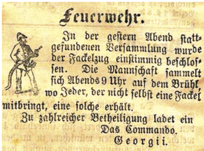
So rief im Mai 1871 die Calwer Feuerwehr zum Fackellauf auf. Die Annonce erschien im Calwer Wochenblatt, das jeder im digitalen Calwer Kreisarchiv einsehen kann.