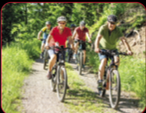
Kulinarische E-Bike-Tour Samstag, 03.09.2022