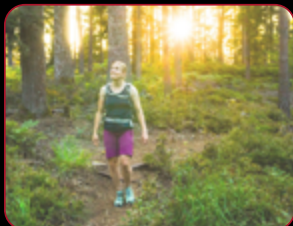
Picknick Erlebnistour Fr, 09.09.2022 + Sa, 17.09.2022